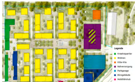
Im Lageplan oben links ist das grün gefärbte F-Gebäude gut erkennbar.

Mit der Sanierung des sogenannten „F-Gebäudes“ (siehe Lageplan) und Umgestaltung zu hochwertigen Büro-