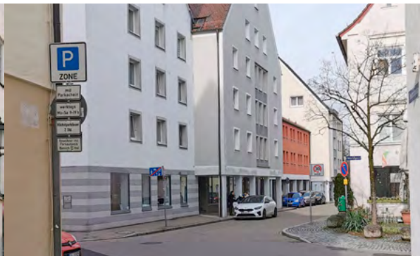
Heinrichgasse: P-Zone an, verkehrsberuhigter Bereich aus, Zone 30 an, rechts eingeschränktes Halteverbot

Das Konzept ist übrigens knapp ein halbes Jahrhundert alt, erste Modellprojekte wurden ab 1977 realisiert, die Einführung in die StVO erfolgte 1980. Natürlich gibt es auch hier Verwaltungsvorschriften: Die Ausweisung von verkehrsberuhigten Bereichen setzt voraus, dass die in Betracht kommenden Straßen, insbesondere durch geschwindigkeitsmindernde Maßnahmen, überwiegend Aufenthalts- und Erschließungsfunktion haben. Das bedeutet, dieser Bereich muss baulich so angelegt sein, dass der typische Charakter einer Straße mit Fahrbahn, Gehweg, Radweg nicht vorherrscht. Gehsteige müssen also verschwinden, was durch einen niveauequalisierenden Aus- bzw. Aufbau der bisherigen Fahrstraßen und andere Maßnahmen erreicht werden kann. Vielleicht kann solches ja in Kempten auch schrittweise vonstatten gehen.