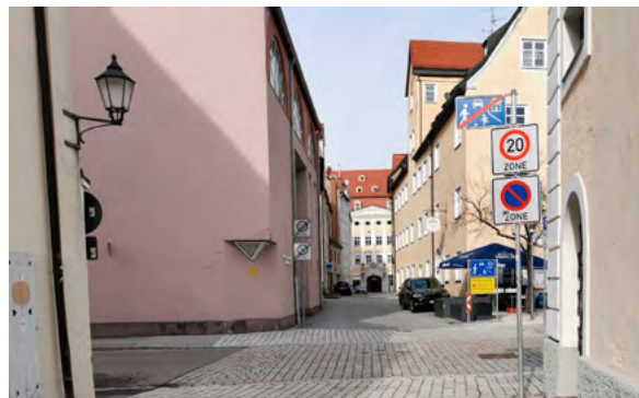
Schützenstraße Richtung Reichsstraße: Ende verkehrsberuhigter Bereich, Beginn Zone 20, Ende Zone 20 - und rechtsrum nicht zu früh freuen: Hier beginnt unmittelbar Zone 10.

Und vielleicht können dann die massiven Blumenquader auch mal etwas hübscherem weichen, statt den Charme eines Armeegrenzpostens zu versprühen. Ebenso kann dann immer noch die Diskussion geführt werden, ob man am St.-Mang-Platz ab Höhe Reichsstraße bis Ende der Bäckerstraße zusätzlich eine Einbahnstraße braucht.