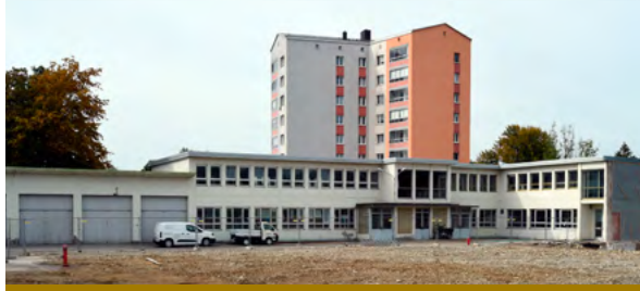
Bereits im Herbst 2023 startete die Sozialbau die Sanierung des F-Gebäudes zu hochwertigen Büro- und Kreativflächen.

und Kreativflächen startete die Sozialbau bereits im Herbst 2023. Die spezielle Ursprungsarchitektur der sechziger Jahre bleibt erhalten. Die Entkernung, Sicherung und statische Ertüchtigung des Daches sowie der Abbruch der angrenzenden Halle waren im Vorfeld termingerecht abgeschlossen worden.