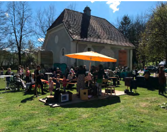
Begrüßungsfest für die Hühner am 21. April 2023