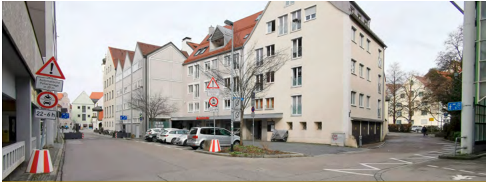
Links zum „Checkpoint Charlie“ Beginn verkehrsberuhigter Bereich, rechts in die Grünbaugasse Ende Zone 20 und Ende Haltezone, Beginn verkehrsberuhigter Bereich