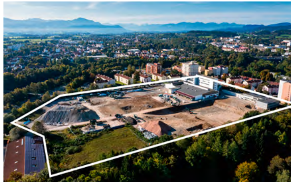
Ab Frühjahr 2024 erstellt die Sozialbau in der Parkstadt Engelhalde 400 neue Miet- und Eigentumswohnungen.

Die öffentliche Erschließung im Quartier wird autoarm erfolgen. Über eine Zufahrtstraße, die verkehrsbe-