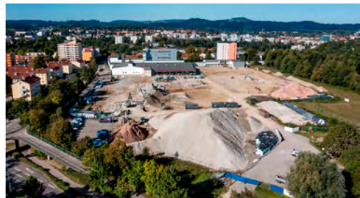
Im Vordergrund die großen Haufwerke von rund 30.000 Tonnen gebrochenem Beton.

oder wird als sogenannter R-Beton zum Recycling-Beton ökologisch wertvoll umgewandelt. Auch 1.500 Tonnen Stahl gehen sortenrein in die Kreislaufwirtschaft zurück. So findet eine professionelle Trennung zwischen Entsorgung und Wiederverwendung von Baustoffen, im Fachjargon „Urban Mining“, statt.