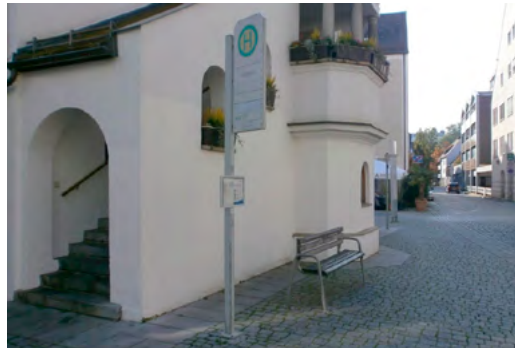
Haltestelle „Rathaus“: weiterhin keine Überdachung, keine Barrierefreiheit, schwieriges Pflaster

Wo wir nun schon bei der Stadtbildsatzung sind: Diese darf und soll