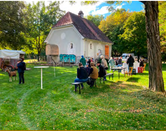
Ziegen am Reglerhaus