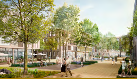
So könnte der zentrale, autofreie Platz in der Parkstadt Engelhalde aussehen.

teilung und Versorgung erfolgt über die Sozialbau-Tochter ZEUS GmbH.