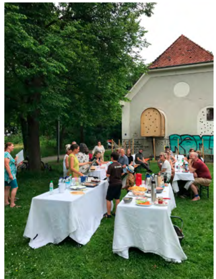
Quartiersfest im August 2023