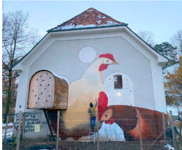
Graffiti-Künstler Loomit sprüht im November 2024 einen Blickfang auf die Ostseite des Gebäudes