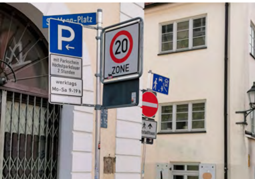
Ende Zone 10 km/h und Schilderwald an der Ecke St.-Mang-Platz / Schützenstraße