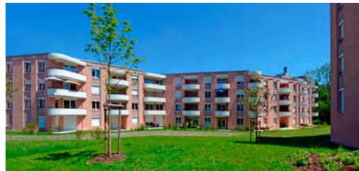
Der barrierearme Binnenbereich des hochwertigen Wohnparks bleibt komplett frei von Verkehr.

tebauliche Setzung ein und ergänzt diese um neue Gemeinschaftsflächen und Spielflächen in zentraler Lage. Die roten und hellgrauen Putzfassaden mit vertikalen Rücksprünge werden ergänzt durch farblich passend gefasste Absturzsicherungen aus weiß pulverbeschichtetem Profiblech.