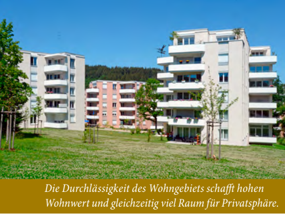
Die Durchlässigkeit des Wohngebiets schafft hohen Wohnwert und gleichzeitig viel Raum für Privatsphäre.

Binnenbereich mit dem aufgewerteten Biotop des hochwertigen Wohnparks komplett frei von Verkehr und wurde attraktiv begrünt gestaltet. Die Leutkircher Straße wurde verkehrsberuhigt erneuert, daran entlang eine Bushaltestelle eingerichtet und 63 öffentliche Stellplätze mit zwei Ladestationen für Elektrofahrzeuge geschaffen. Alle drei Tiefgaragen sind ebenfalls für die E-Mobilität vorgerüstet. Die Energieversorgung erfolgt ökologisch überzeugend durch die Neuanbindung des gesamten Stadtteils an das regionale Fernwärme-Netz des ZAK (Zweckverband für Abfallwirtschaft Kempten).